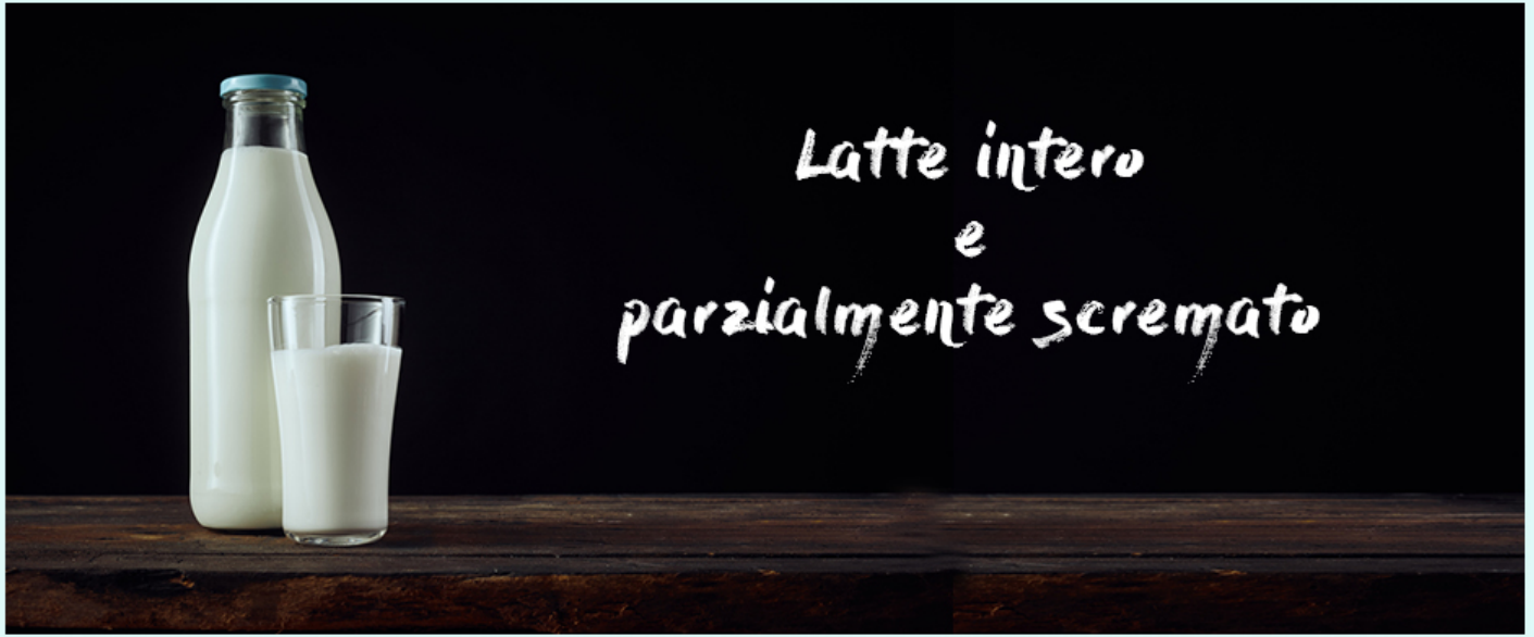
TABELLA COMPLETA GRUPPO LATTE, YOGURT, FORMAGGI